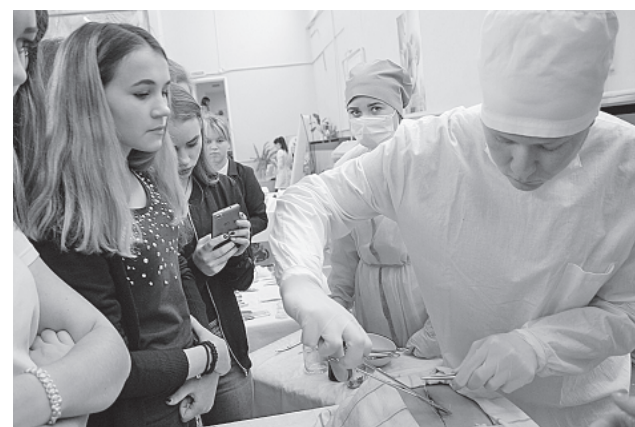
Все медицинские манипуляции студенты проводили на муляжах