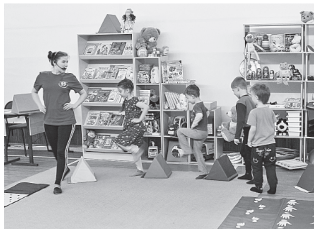
Студентам педколледжа помогли детсадовцы

Даже кратковременные визиты на конкурсные площадки чемпионата оставили неизгладимое впечатление! В автодорожном колледже студенты-метрологи оказались вполне компетентны в вопросах владения высокотехнологичным оборудованием. Конкурсные задания по ремонту и обслуживанию легковых автомобилей также выполнялись быстро, чётко. В следующем году автодорожный колледж планирует состязаться в новой компетенции — «Геодезия».