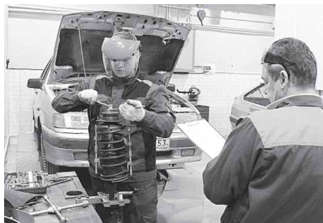
Соревнования в АДК в компетенции «Ремонт и обслуживание автомобилей»